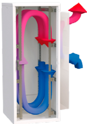
PRŮTOK VZDUCHU ROZVADĚČEM – COOLSPOT DX WM VERZE